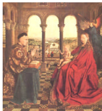
Quadro apresentado no vídeo Milagre na Loggia

Pós-Oficina: Os participantes serão convidados a participar de um fórum de discussão na Web com a participação dos proponentes, onde terão oportunidade de dar continuidade e aprofundar seus conhecimentos sobre RS e o software GRS.